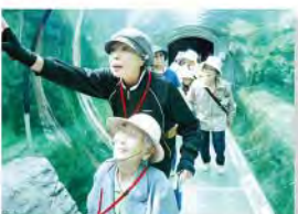
旭山動物園ドライブ