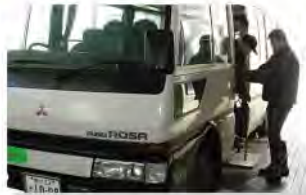
リフト付きの送迎車輛