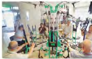
ボディスパイダー

ご利用者個々の機能が維持・向上できるよう機械（ボディスパイダー・エアロバイク等）も用意しています。